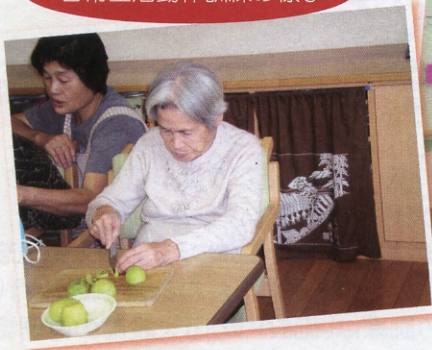
日常生活動作訓練の様子

泊りは介護保険適用のサービスで全室個室(洋室4室・和室1室)を用意しております。