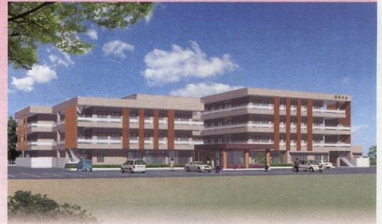
新施設完成予想図