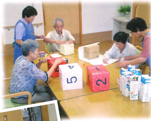
手芸(サイコロづくり)