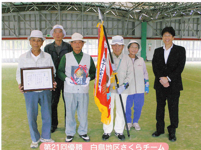
第21回優勝 白鳥地区さくらチーム