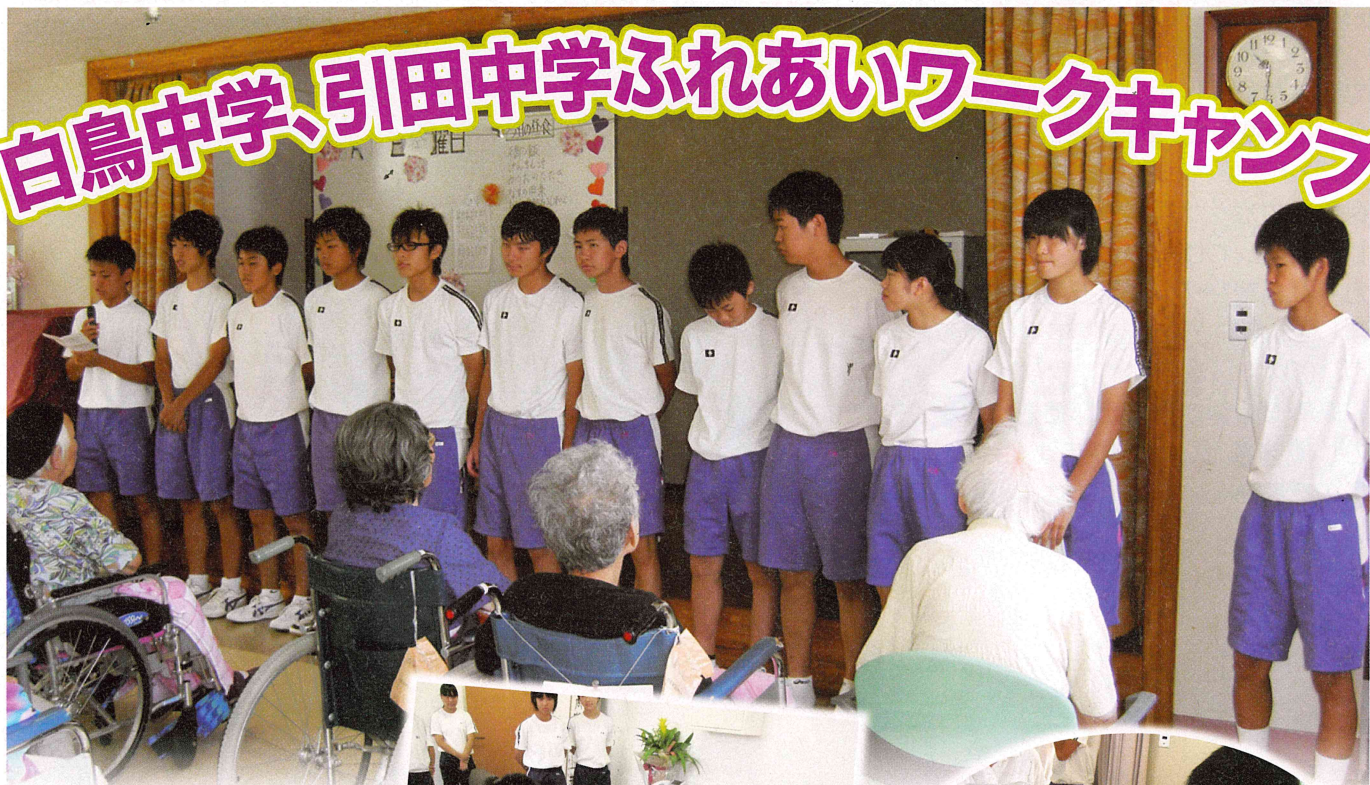
車椅子体験・操作説明